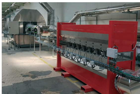
Power to heat