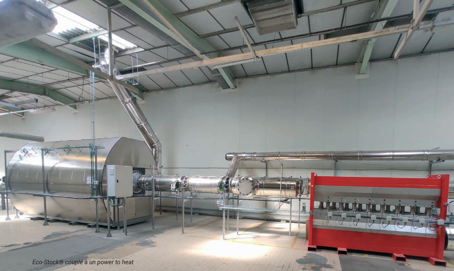
Eco-Stock® couplé à un power to heat