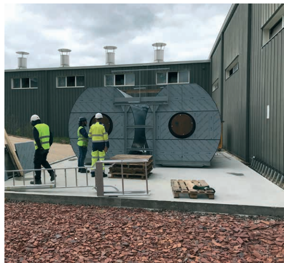
Mise en place des deux Eco-Stocks® sur le site de Pontigny.