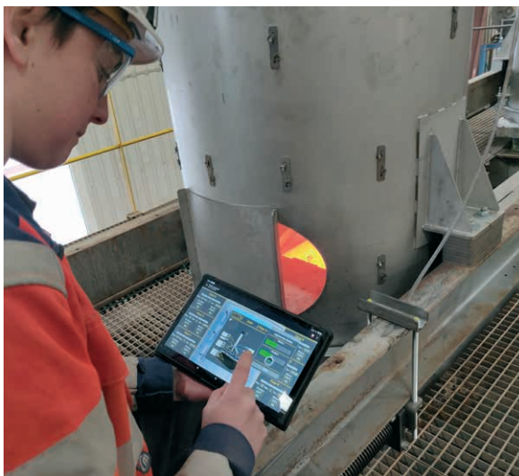
Essais lors de la mise en service d'un système de captage de fumées à haute température sur un des fours de tuilerie et validation du contrôle commande et des systèmes mécaniques, site de Pontigny.

Les données techniques sont donc identiques pour les deux cas, en revanche, l'évolution des données économiques et environnementales est indiquée chaque fois que nécessaire.